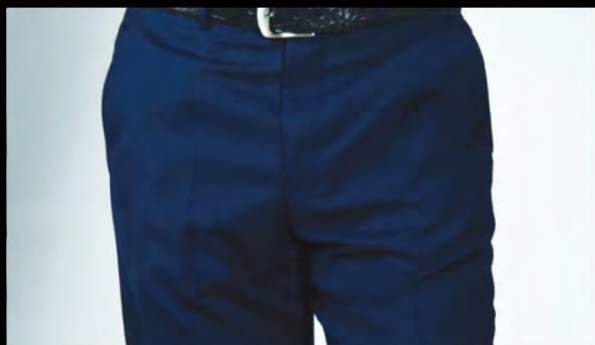
レーヨン素材のパンツ

スーツや礼服などのプリーツ(折り目)はしっかりと残しながら、全体のしわを除去します。パンツスタイルで気になるプリーツを残したまま、縮みや傷みの気になる衣類のお手入れができます。