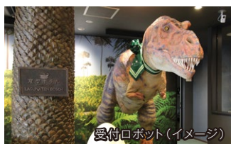
受付ロボット(イメージ)

小学生まで添い寝可能で、1室の総額がお得に。素泊まりはもちろん、入園や食事などの特典つきプランまで、お客様の目的と予算に合わせて多様なプランをご用意しています。ロボットホテル体験は忘れられない思い出に!