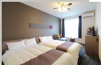
スタンダードツイン(2~3名様利用)

小さなお子様と一緒にでもゆっくりお過ごしいただけるよう、バス・トイレは別に。お休みの際も、ベッドは横幅120cmのセミダブルサイズの最新マットレス(プレスエア®使用)を導入し、良質な睡眠時間をお約束します。ファミリーでも、グループでも、カップルでも、皆様が快適にお過ごしいただけるお部屋をご用意しております。