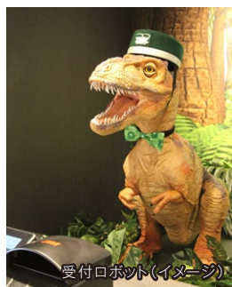
受付ロボット(イメージ)

館内では様々なロボットが大活躍。子どもも大人もワクワクすること間違いなし!ロボットたちが旅の楽しい思い出を作ります。