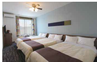
スタンダードトリプル(3名様利用)

最大4名で宿泊可能なお部屋です。ゆとりある広さで、ファミリーはもちろん、グループ、女子旅など幅広くご利用いただけます。