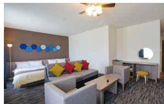
デラックスツイン(2~4名様利用)

開放感のある広々としたお部屋。大人4名様、添い寝のお子様合せて最大6名様まで宿泊可能です。