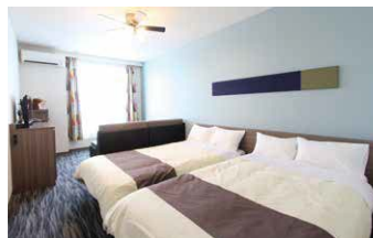
スタンダードフォース(4名様利用)

カップル、ファミリーにおすすめのお部屋です。3名ご利用時は、ソファベッドを展開し、ベッドと同様の快適な寝心地に。