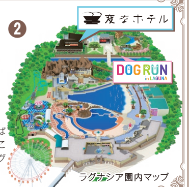
ラグナシア園内マップ

宿泊者専用ゲートから園内へ! 新エリアまでは徒歩1分、橋を渡ればアトラクションやプールもすぐそこなので、ホテルから出てすぐにラグナシアを楽しめます!