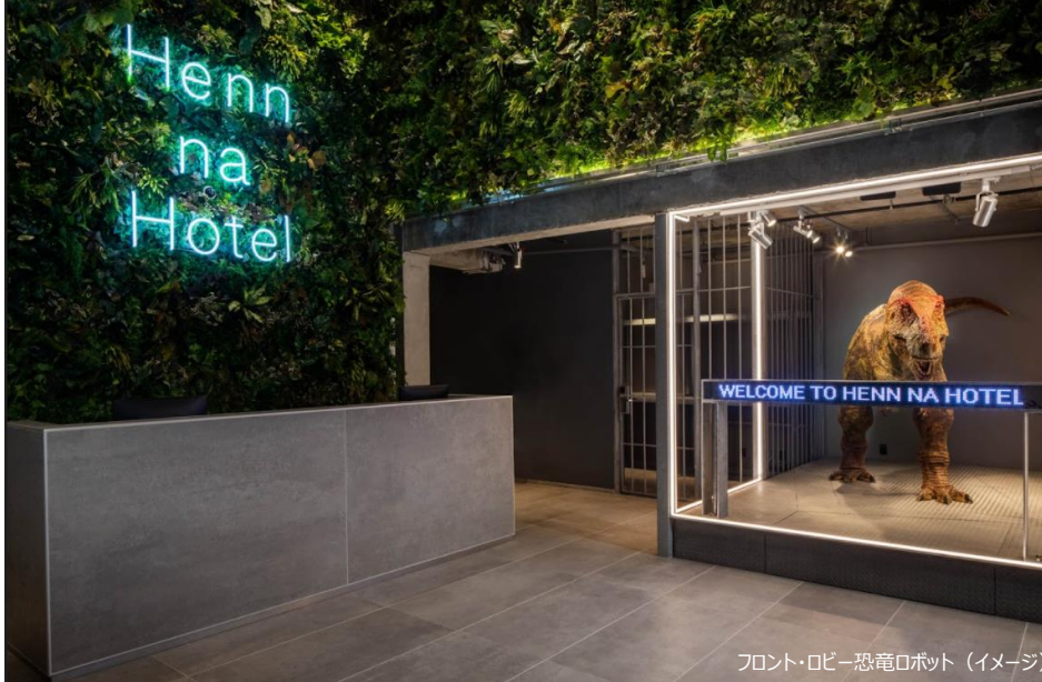
フロント・ロビー恐竜ロボット（イメージ）

H.I.S.ホテルホールディングス株式会社（本社：東京都港区）は、「変なホテル ニューヨーク」を2021年10月1日（金）に新規開業いたします。「変なホテル」の海外進出は韓国に続き2棟目、国内外あわせて21棟目となります。