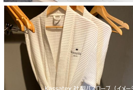
Kassatex 社製バスローブ (イメージ)