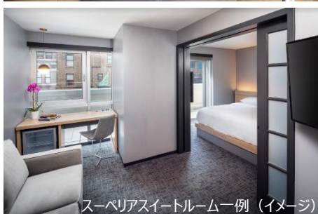
スーペリアスイートルーム一例 (イメージ)