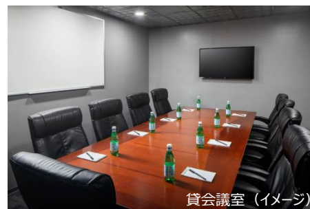
貸会議室 (イメージ)