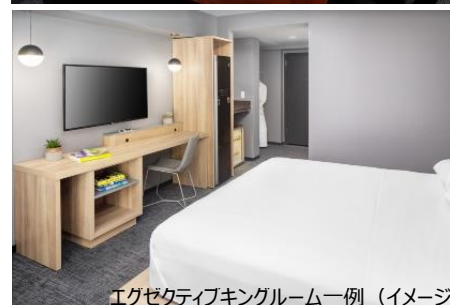
エグゼクティブキングルーム一例 (イメージ)