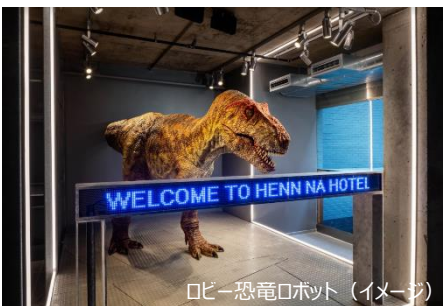
ロビー恐竜ロボット (イメージ)