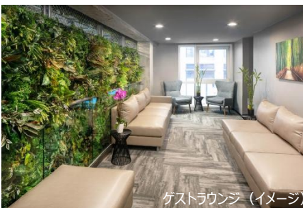
ゲストラウンジ (イメージ)