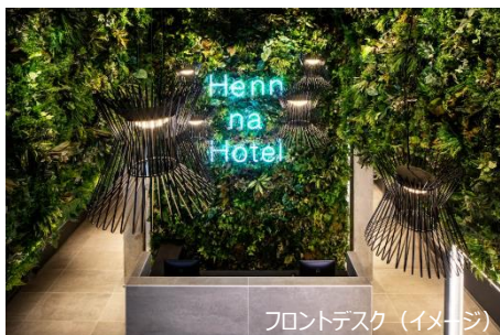
フロントデスク (イメージ)