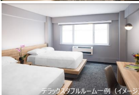
デラックスダブルルーム一例 (イメージ)