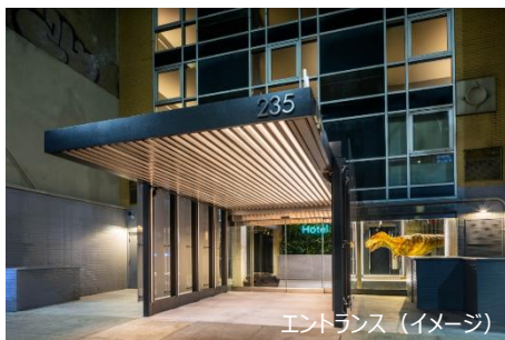
エントランス (イメージ)