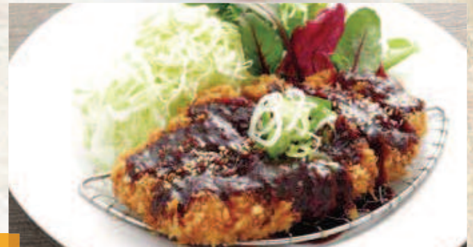
みそかつ定食 1,210円(税込) みそかつ単品 810円(税込)