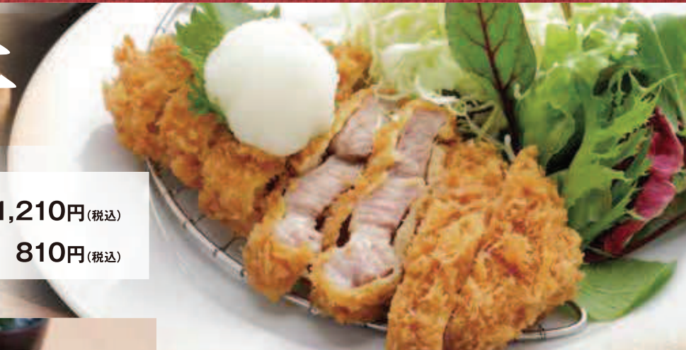
とんかつ単品 810円(税込)