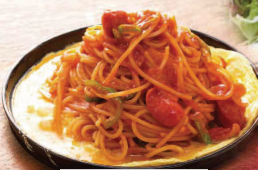
鉄板ナポリタン 900円(税込)