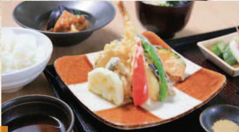
天ぷら定食 1,390円(税込) 天ぷら単品 990円(税込)